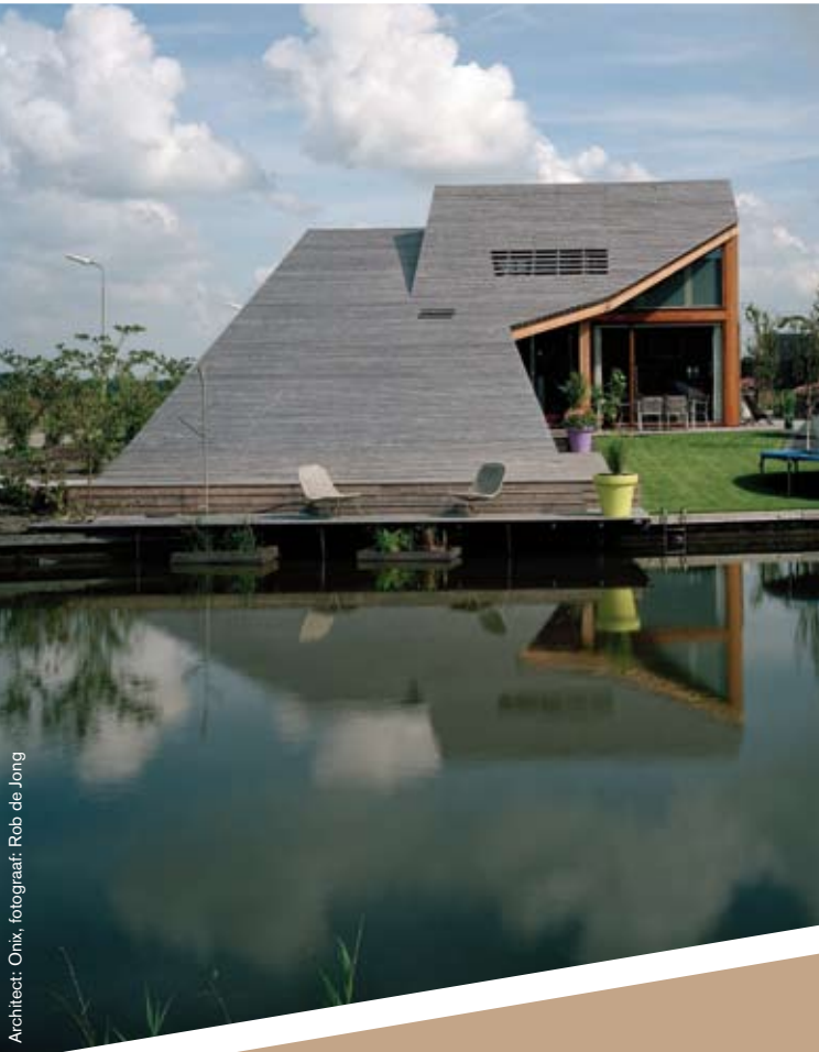
Architect: Onix